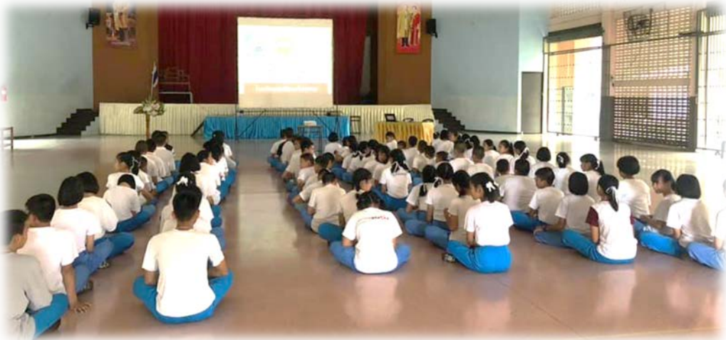
จัดการเรียนการสอนให้นักเรียนทุกคนได้รับการพัฒนาให้เกิดคุณธรรม มีจิตสำนึกความสุจริตมีคุณลักษณะอันพึงประสงค์