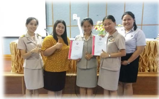
จัดทำหลักสูตรด้านทฤษฎีให้กับนักเรียนทุกระดับชั้น