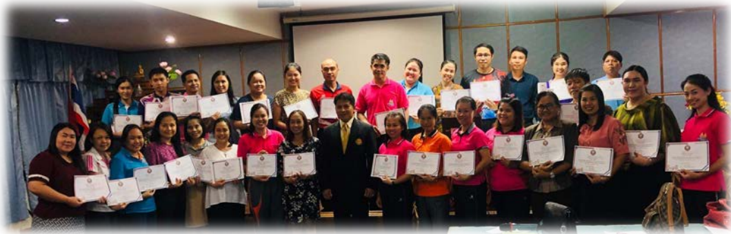
กิจกรรมส่งเสริมการจัดการเรียนการสอนตามหลักสูตรด้านทฤษฎี